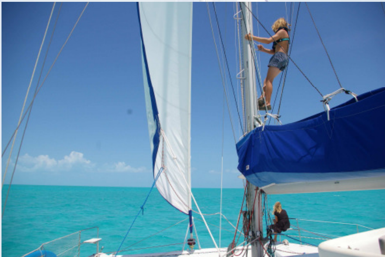
Die Bahamabanks sind wegen der geringen Wassertiefe das! Revier schlechthin für Katamarane