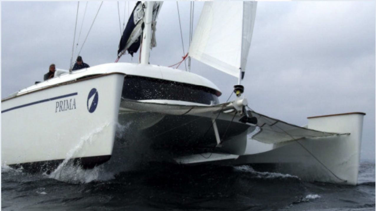
Futura Prima bewährt sich in der bewegten Ostsee

Tests bekannter Segelzeitschriften sind gelaufen und Sie können die Berichte in Kürze lesen (Segeljournal Ausgabe Ende Dezember; Yacht Ende Dezember oder Anfang Januar; Voile, Multihull u.a. folgen; außerdem erscheinen noch Berichte in überregionalen Tageszeitungen wie z.B. der FAZ).