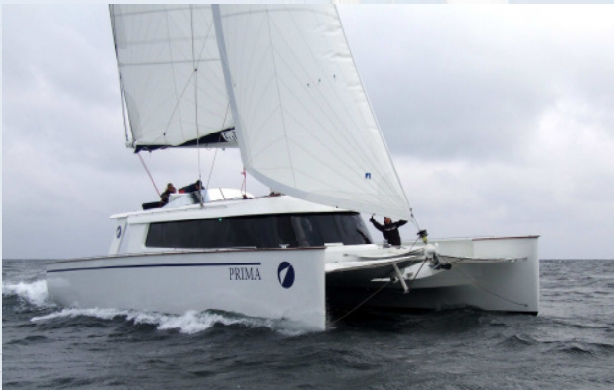
Futura mit 15Knoten auf Halbwindkurs

Da standen die Segel noch gar nicht richtig, schon musste die nächste Wende folgen, da das Schlauchboot bei der hohen Welle einfach nicht hinterherkam.