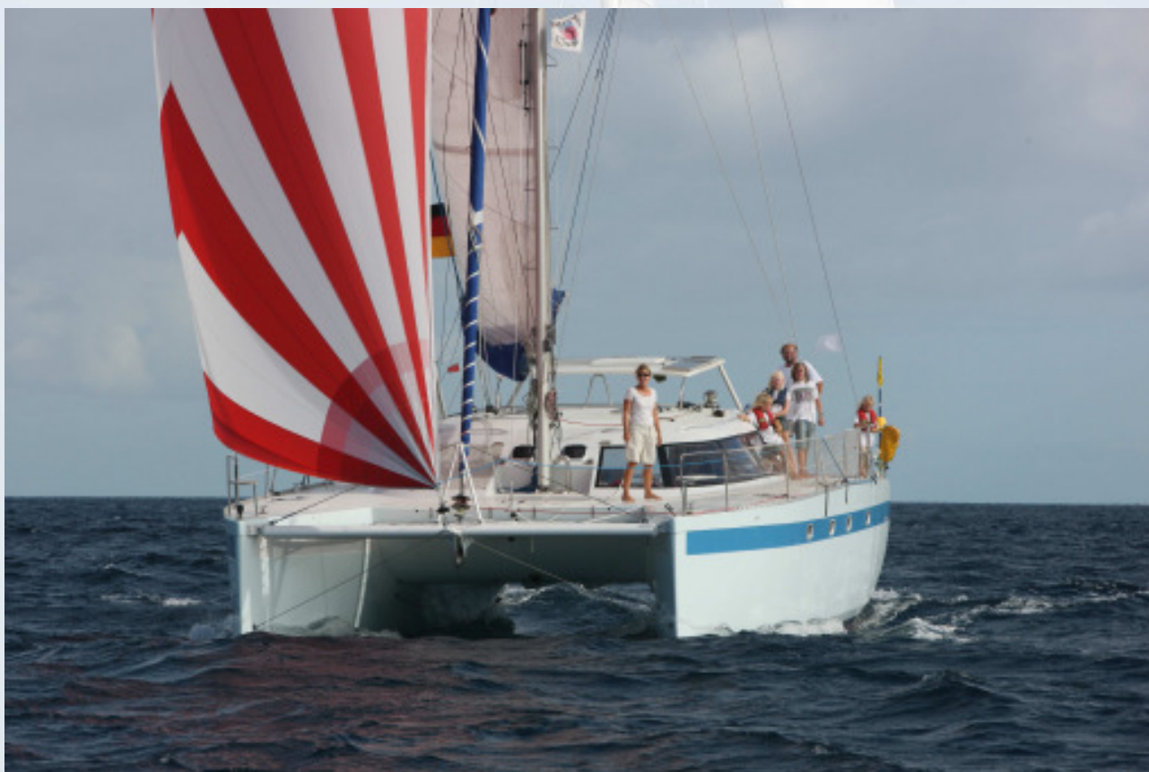
Hundertwasser bei der Regatta auf Grenada

Die BaltiCat 43 „ Hundertwasser “ hat den Hurrikan „Irene“ in der Nähe von Long Island (New York) glücklicherweise ohne Schäden überstanden. Letztes Jahr nach dem Sieg beim BaltiCup losgefahren, ging es über Holland, England, Frankreich, Spanien und Marokko im November zu den Kanaren. Mit reichlich Zeit im Gepäck wurde z.B. direkt unter dem Big Ben in London festgemacht oder das Boot für einige Zeit gegen Wüstenschiffe in der Sahara eingetauscht. Kaum in der Karibik angekommen nahm man an der Regatta in Grenada teil wo der 2.Platz hinter einem größeren Multihuller eingefahren wurde.