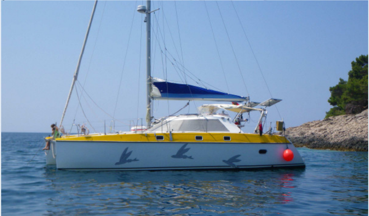
Die Flying Fish

Die BaltiCat 42 „ Flying Fish “ ist glücklich mit der ARC (Atlantic Ralley for Cruisers) über den Atlantik gestartet. Wir wünschen der kleinen familiären Crew um Claudius eine glückliche Hand bei der Kurswahl und ein stressfreie, fröhliche Überfahrt.