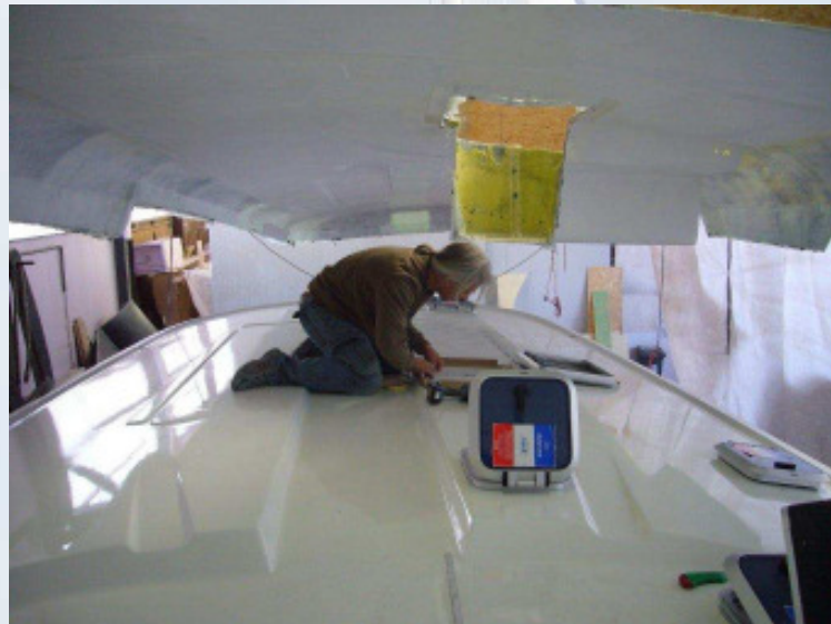
Der Werftchef bei der Lukenpositionierung

Momentan werden die Decksbeschläge montiert und der Wohnbereich der Gondel wird in Kaya und Teak ausgebaut.