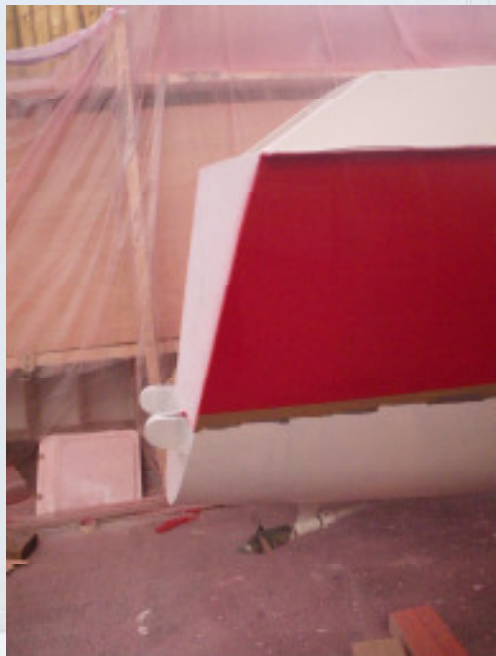
MAI TAI vorher...

Bitte meldet Euch umgehend bei uns, wir freuen uns auf jeden Teilnehmer. Jetzt, da eine der bekanntesten Ragattaveranstaltungen uns Mulihullern diese Plattform (Medienpräsenz!) anbietet, sollten wir die Gelegenheit unbedingt nutzen.